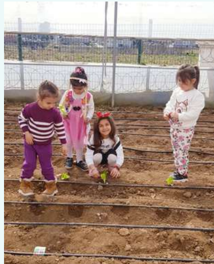
Kozluk Mesleki ve Teknik lisesine giderek okuldaki meslek alanlarını yerinde inceledik ve serada ekim yaptık .