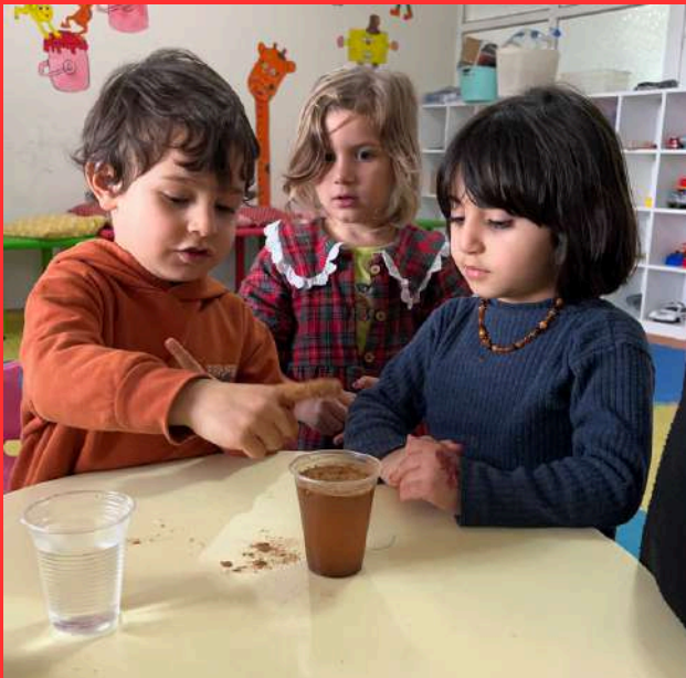
Islanmayan parmak deneyi

fen ve doğa eğitimi, çocukların nesnelere ve olaylar arasındaki ilişkileri anlamalarını, bilişsel, duyuşsal ve motor becerilerinin gelişimini destekler, sosyalleşme sürecini hızlandırır, öğrenmelerini kolaylaştırır ve olaylara bilimsel açıdan yaklaşma becerisi kazandırır.