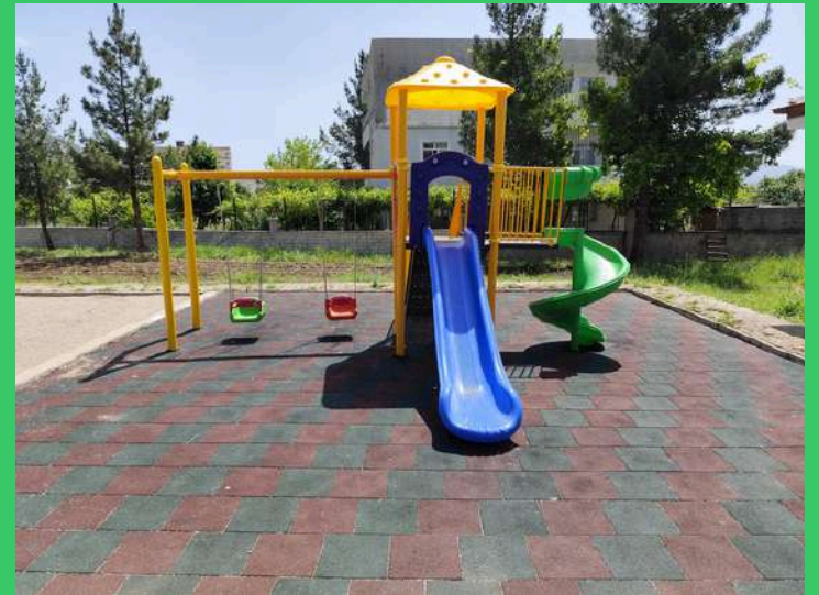
5 Park alanımız