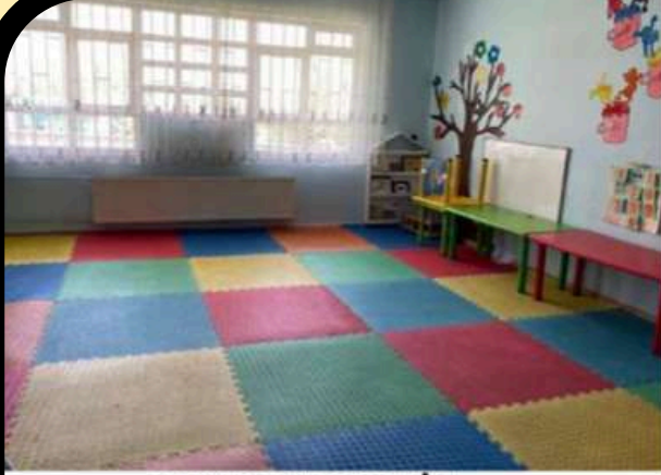
3 YAŞ ŞUBEMİZ