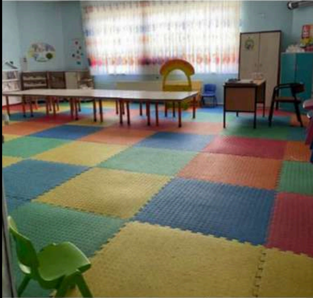
5 YAŞ A ŞUBEMİZ