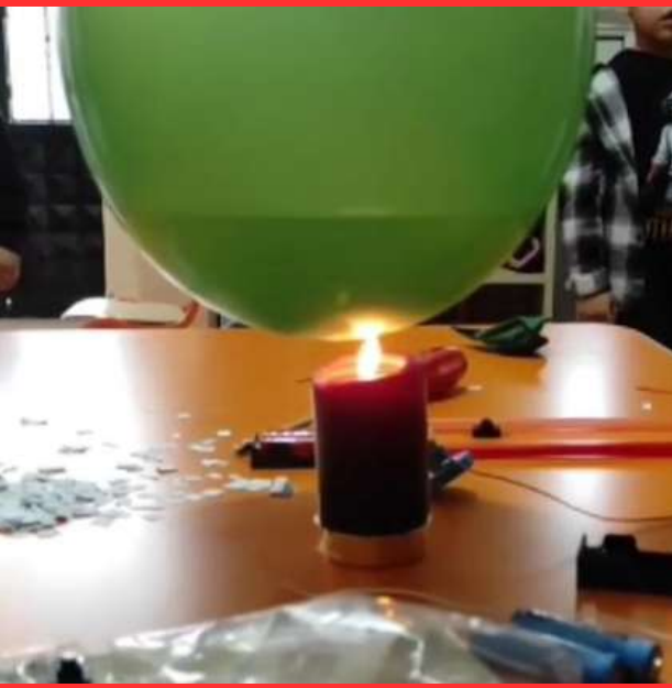
Patlamayan mum deneyi