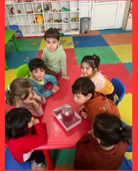
Yükselen su deneyi