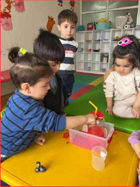
Kanın pompalanması deneyi