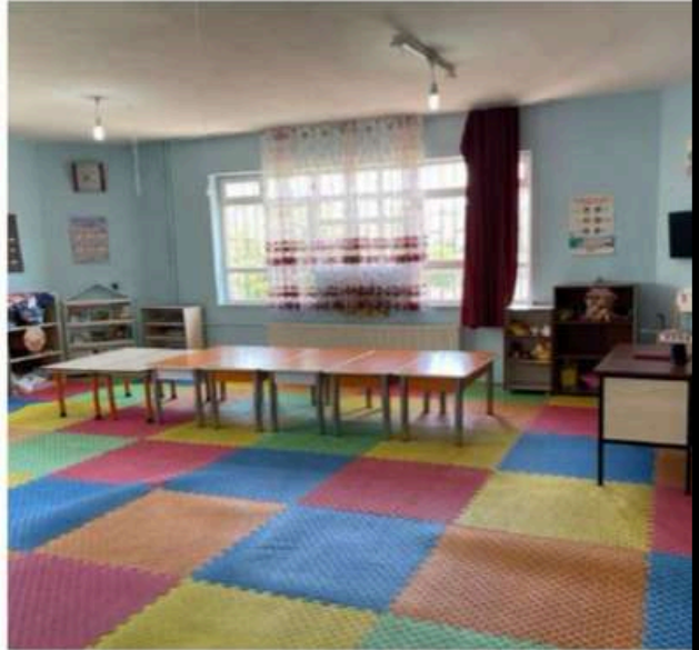
5 YAŞ B ŞUBEMİZ