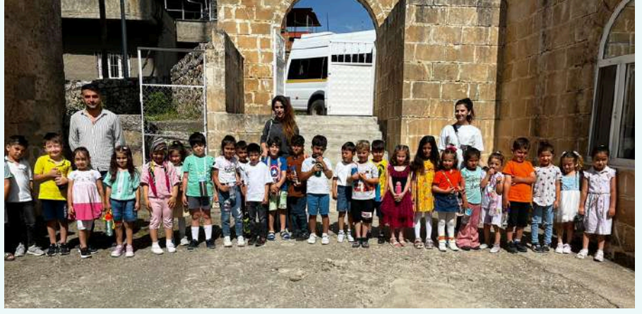
İlçemizin tarihi camisi olan İbrahim bey camisini ziyaret ettik.