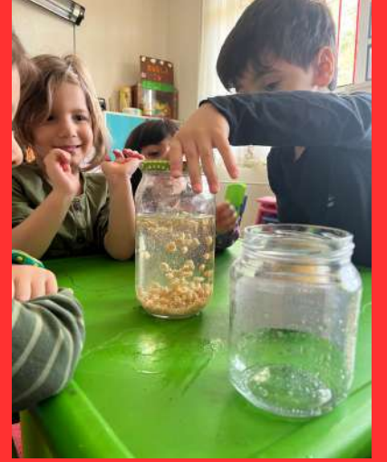
Dans eden mısırlar deneyi