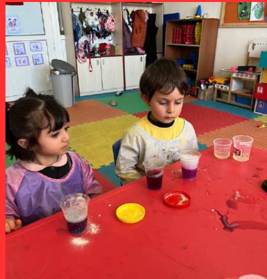
Renk deęiřtiren mor lahana deneyi